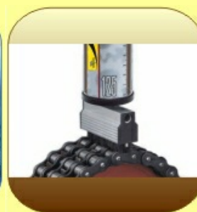
Schmiergeräte, el. Schmierautomaten